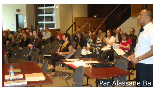
Par Alassane Ba

Voici quelques statistiques sur la provenance des participants du Rendez-vous :