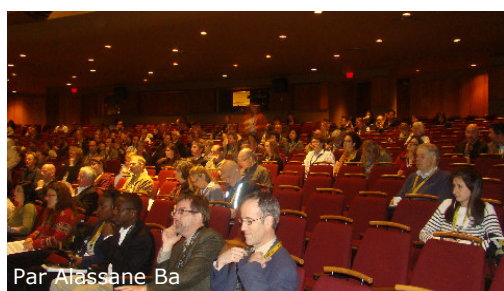
Par Alassane Ba

Plus de 500 participants ont pris part au Rendez-vous international sur la gestion intégrée de l'eau qui s'est tenu du 1 er au 3 juin 2009. L'événement a été organisé conjointement par le Conseil de gouvernance de l'eau des bassins versants de la rivière St-François (COGESAF) et le Centre universitaire de formation en environnement de l'université de Sherbrooke (CUFE). 30 ateliers ont été présentés par 95 conférenciers dans cinq salles portant sur des thématiques distinctes de la gestion de l'eau.