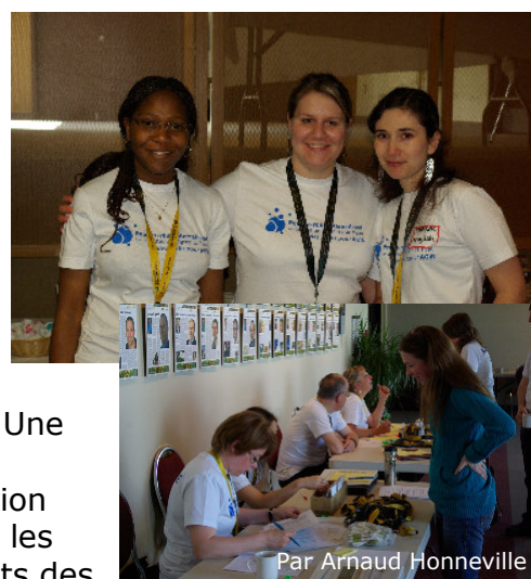
Par Arnaud Honneville

Un événement écoresponsable implique de tenir compte des volets du développement durable dans l'élaboration d'un événement. Sur le plan environnemental, des mesures de réduction à la source, de récupération, de recyclage et de mise en valeur des matières résiduelles (compostage) ont été adoptées durant la période de mise en œuvre du Rendez-vous. Sur place, une équipe verte a assuré une participation accrue des participants aux mesures proposées. Une navette gratuite entre les hôtels et les lieux de l'événement a réduit le nombre de déplacements en voiture et une contribution en argent est remise à l'organisme Planet'air pour compenser les 71,7 kilos de gaz à effet de serre générés par les déplacements des participants. Sous forme de « crédits de carbone », ces fonds serviront au financement de projets d'énergie renouvelable et d'efficacité énergétique.