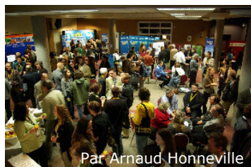
Par Arnaud Honneville