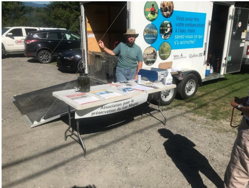
Figure 2. Station de lavage mobile du MFFP et table de démonstration d'EAAE lors des activités de sensibilisation à l'été 2020

Pour finir, l'équipe du COGESAF était aussi outillée pour répondre aux questions des intervenants locaux, par exemple les associations ou les municipalités (élus et employés). En effet, plusieurs questions en lien avec l'implantation d'une station de lavage fixe ou mobile ont été adressées lors des événements. D'ailleurs, les événements planifiés à l'été 2020 faisaient partie de la planification des organismes locaux pour l'installation de station de lavage fixe ou mobile.